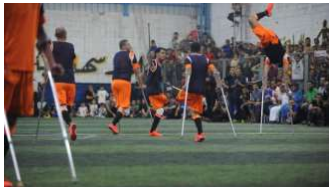
Photos du match organisé en juin dernier, prises par le photographe gazaoui Ashraf Amra.

"Au début, certains joueurs avaient un peu honte de s'afficher en public"